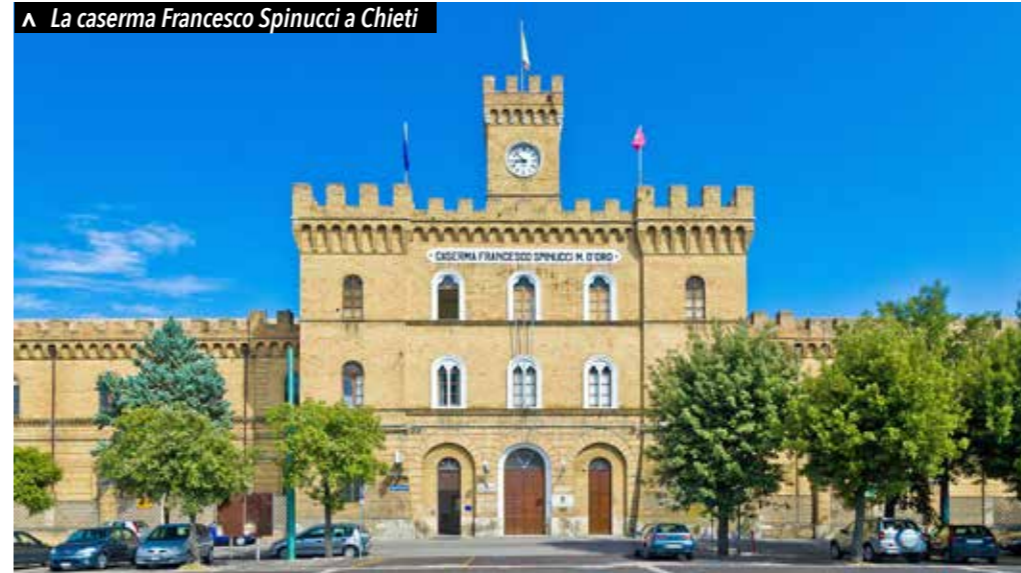
▲ La caserma Francesco Spinucci a Chieti